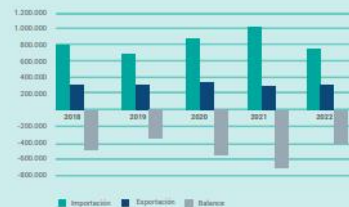
Figura 12. Balanza comercial 2018-2022. Fuente: Odepa y Servicio Nacional de Aduanas