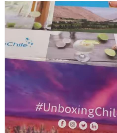
México: Atacama Misión y Unboxing