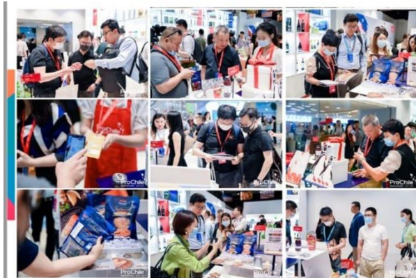
China: Chile y sus regiones