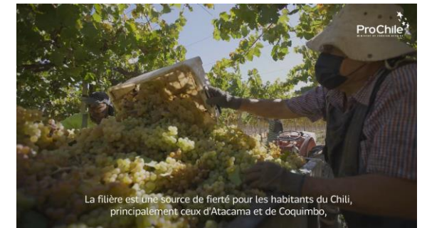
Video Sectorial – Día del Pisco