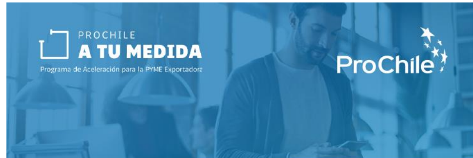
Beneficiarios Pisquera ABA y Tulahuén