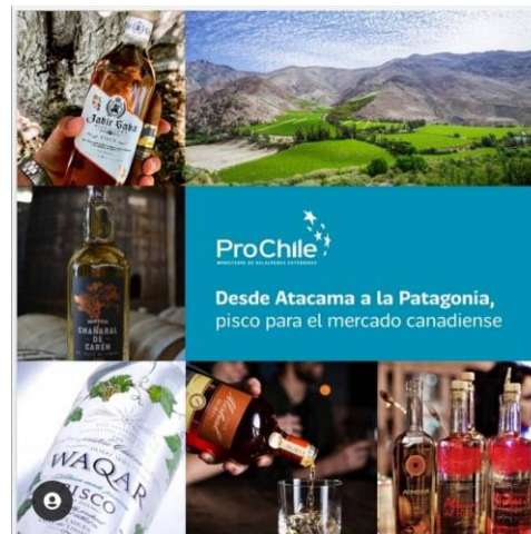
Canadá: Masterclass virtual Cata Virtual Pisco y Gin