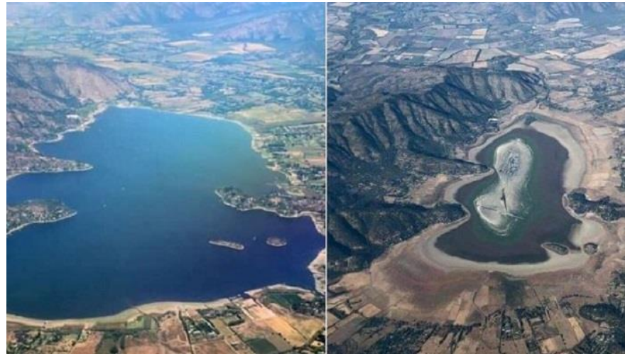
Ref: Laguna Acúleo antes / ahora