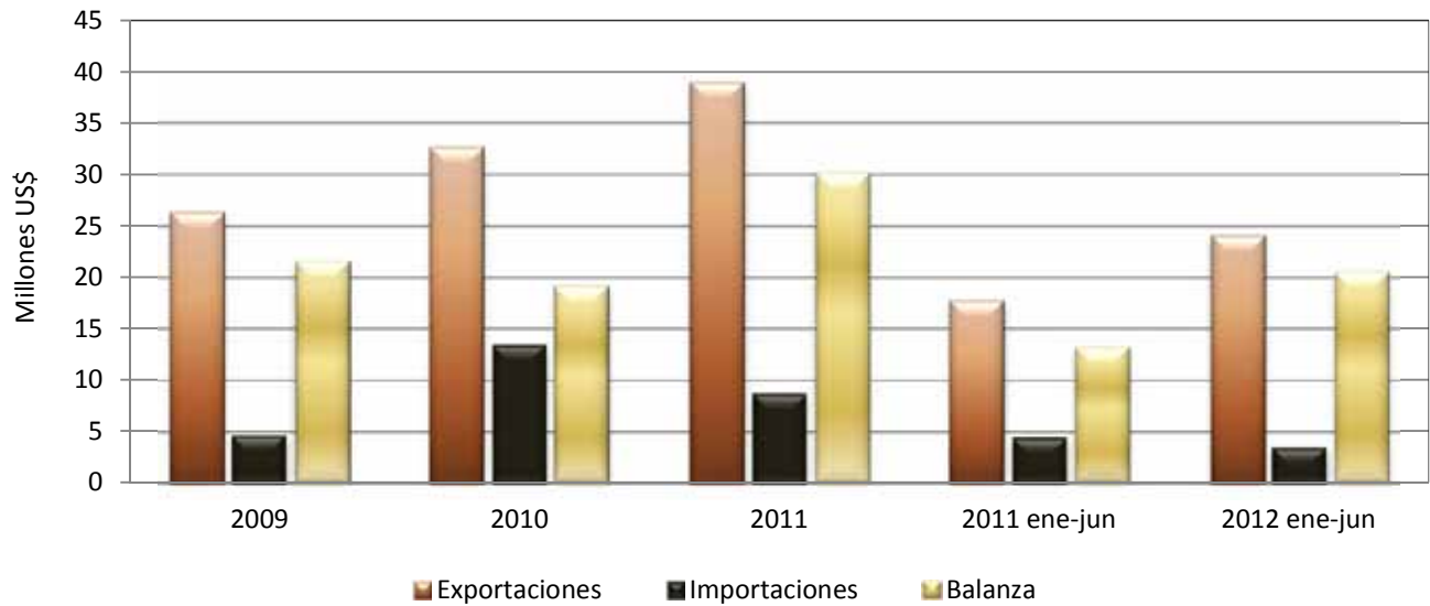
Figura 2. Balanza silvoagropecuaria Chile - Vietnam