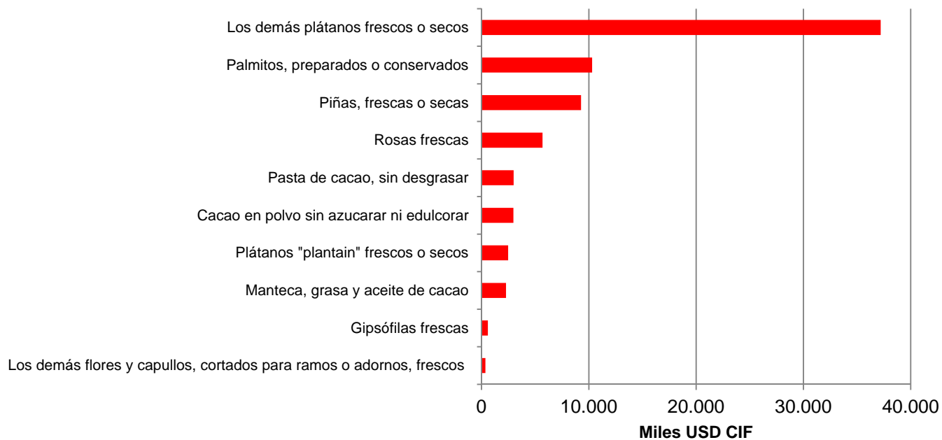
Gráfico 6. Principales importaciones silvoagropecuarias chilenas desde Ecuador, enero-agosto 2013